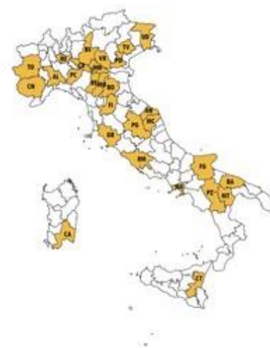
La rete di rilevazione Ismea