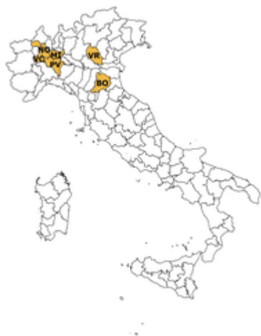
la rete di rilevazione Ismea