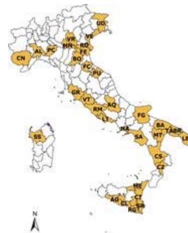
la rete di rilevazione Ismea