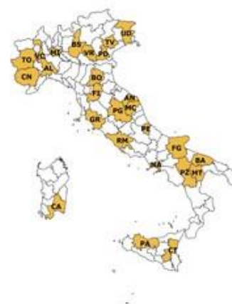
La rete di rilevazione Ismea