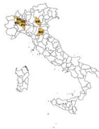
la rete di rilevazione Ismea