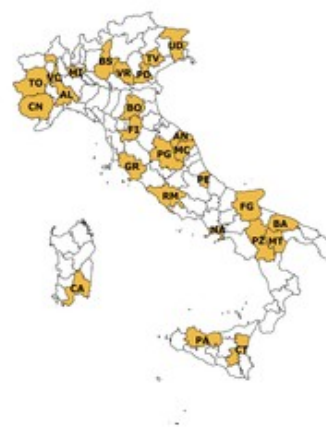
la rete di rilevazione Ismea