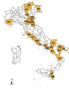
La rete di rilevazione ISMEA

La seconda settimana di maggio ha segnato l'ingresso sui mercati delle prime quote di albicocche, pesche e nettarine precoci di provenienza metapontina con prezzi di esordio in rialzo rispetto a quelli registrati lo scorso anno. Si è intensificata la raccolta per le ciliegie con disponibilità in aumento e prezzi in fisiologico calo. Prosegue favorevolmente l'attività di scambio per le fragole con quotazioni medie in ulteriore fisiologica regressione a fronte dei maggiori quantitativi staccati. Ultime settimane di commercializzazione per pere e kiwi. Si conferma attivo il mercato per le mele da tavola.