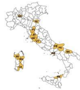
La rete di rilevazione ISMEA