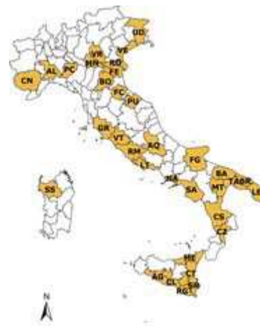
la rete di rilevazione Ismea