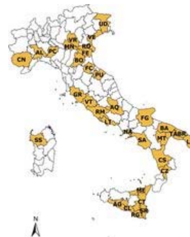
la rete di rilevazione Ismea